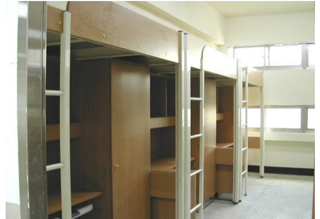
大雅館寢室內部設施