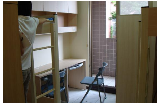
大群館寢室內部設施