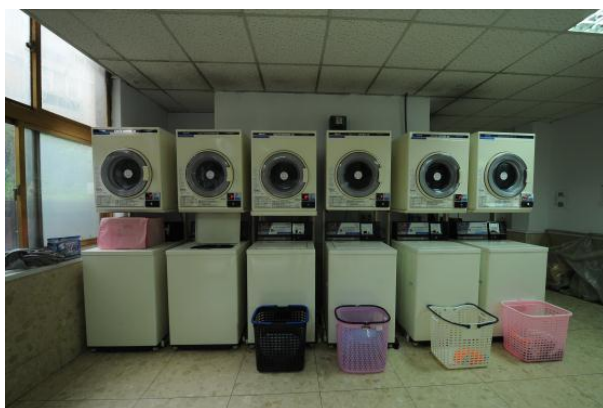
大莊館自助投幣洗衣機、烘乾機